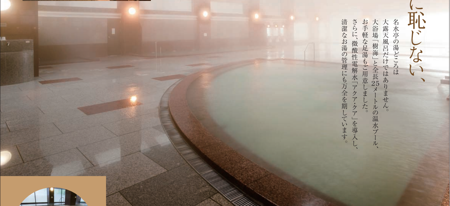
大浴場「樹海（じゅかい）」